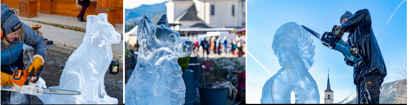
Sculptures sur neige et glace sur le Plan de Ville