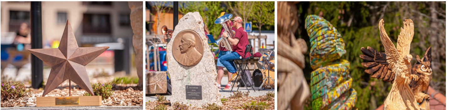
Les Fêtes de la Chartreuse à Saint-Pierre de Chartreuse