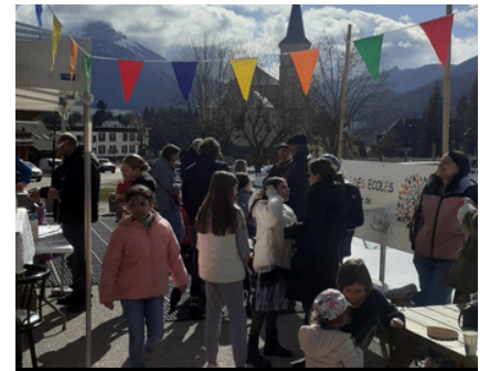
Carnaval du printemps à la patinoire